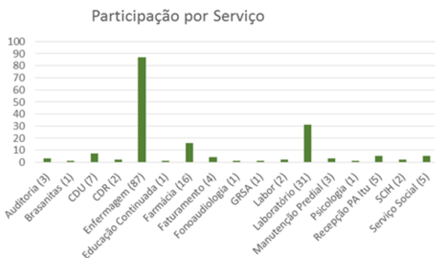
Gráfico 1: Setores dos participantes do treinamento de Qualidade e Segurança do Paciente

O segundo treinamento abordou a meta 1 do Programa Nacional de Segurança do Paciente, que trata da identificação dos pacientes. Também foram abordados conceitos sobre notificação de incidentes. Neste treinamento, que aconteceu entre os meses de fevereiro e março de 2015, em diferentes dias da